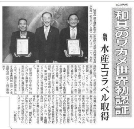
【R1.10.22 (火) 伊勢新聞朝刊】